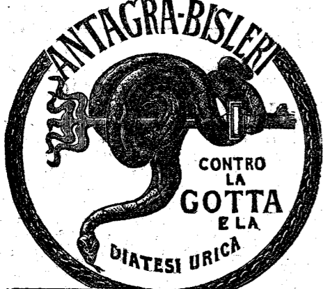
Opuscolo gratis a richiesta FELICE BISLERI & C. - MILANO