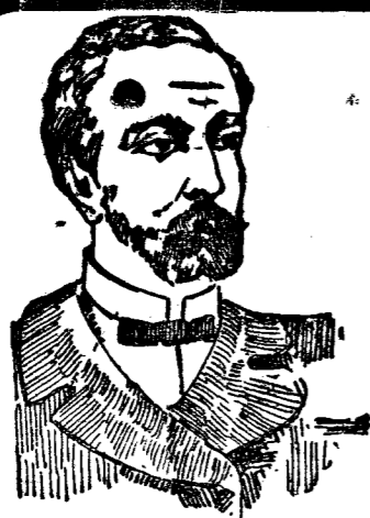
PRIMA DELLA CURA

Collezioni artistiche e galanti Ultime Novità—Grandi Curiosità 9000 nudi e seminudi dal vero grandi fotografie DAL VERO L. 6 ad 144 campioni diff. L. 6 ant. 6 Stereosco (extrafini) su cartone L. 10 anticipate Scrivere: Lamberto Matteini Borgo S. Jacopo, 12 Firenze (Nominate questo giornale) 12 splendide cartoline speciali L. 7 anticipate