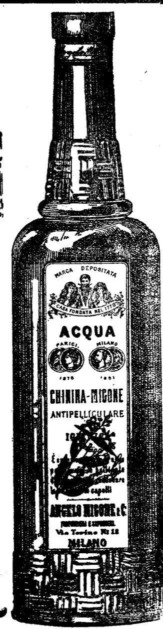
Bottiglie da L. 3,50 - 5 - 8,50