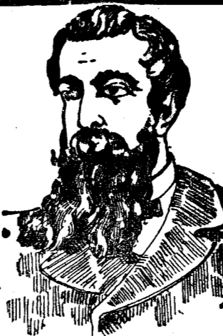
DOPO LA CURA

Una chioma folta e fiutata è degna corona dell'uomo.